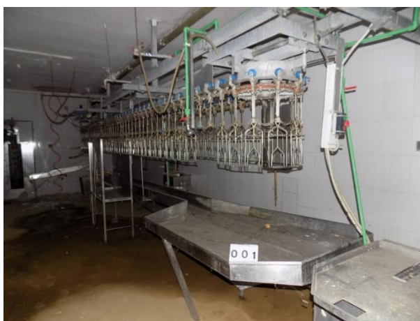
4. Linija za obradu pilića

Rješenjem Županijskog suda u Bjelovaru o imenovanju br. 4 Su-406/98, od 14. veljače 2017. godine, imenovan za: „Stalnog sudskog vještaka strojarske struke“