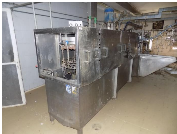
2. Linija za obradu pilića