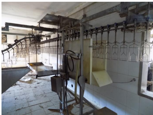
3. Linija za obradu pilića