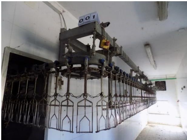
1. Linija za obradu pilića